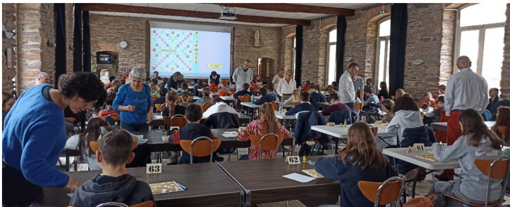
Finale régionale – Mars 2024 à Rennes

Pour information : à l'initiative du Comité Bretagne de Scrabble, des parties de scrabble en ligne d'une durée d'une heure, gratuites, et animées par des licenciés de clubs bretons, sont proposées aux jeunes de 8 à 15 ans chaque mercredi à partir de 18 h ( première séance mercredi 2 octobre s'il y a suffisamment d'inscrits ).