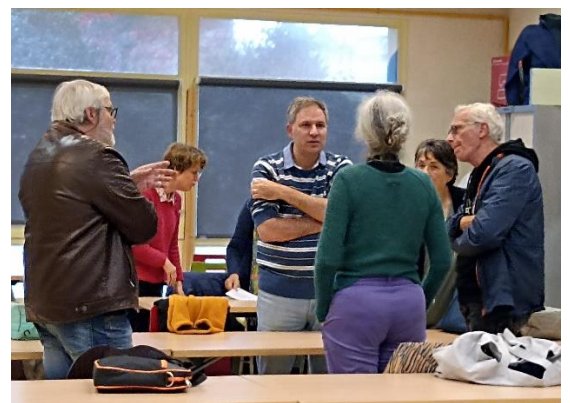
Et beaucoup de discussions lors de la pause