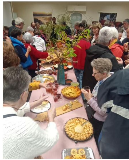
Une superbe décoration florale et un magnifique buffet très apprécié