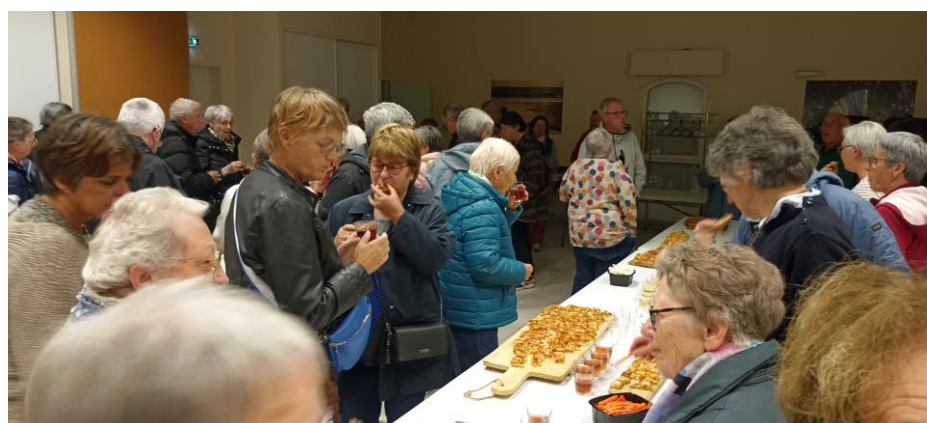
Un buffet réconfortant après des parties originales toujours stressantes...