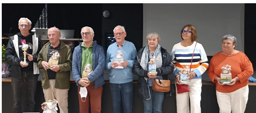
L'ensemble des vainqueurs