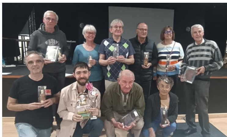
Les vainqueurs, au général et par séries