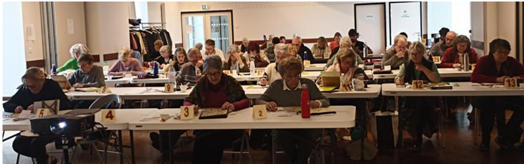
Une salle fraîchement rénovée accueille les joueurs

Au final, six équipes sont accueillies à Saint-Malo : deux de St-Malo (5 joueurs x 2), une de Dinan (7 joueurs), une de St-Pair-sur-Mer (7 joueurs) et deux de Rennes (5 joueurs x 2), plus un joueur du club de La Garena, soit 35 joueurs .