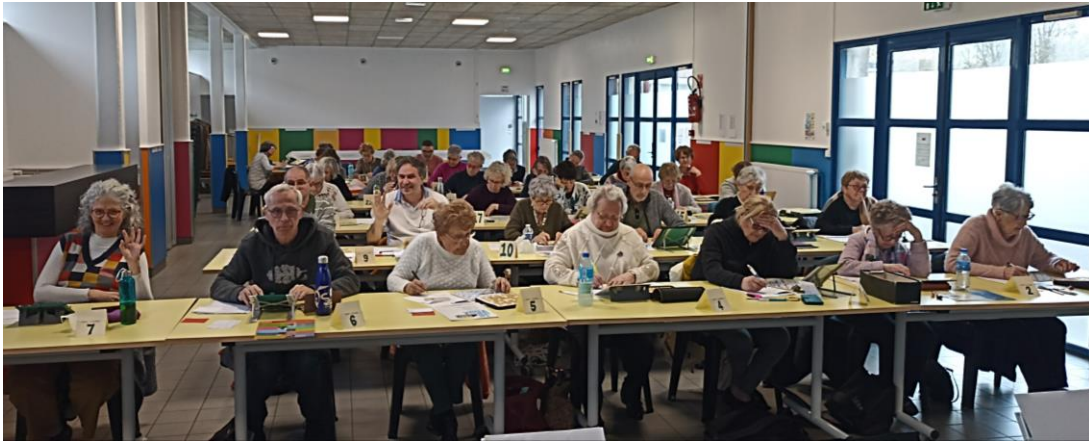
Des joueurs... concentrés ou détendus, qui participent au tournoi pour la bonne cause

Le club de Dinan accueille dans la salle de La Source 34 joueurs . Quatre autres centres sont ouverts en Bretagne : Brest, Muzillac, Perros Guirec et Plérin, ce qui permet de rassembler 130 joueurs (contre 71 l'an dernier sur 3 centres).