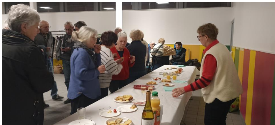
En attendant l'annonce des résultats, partage d'un moment de convivialité